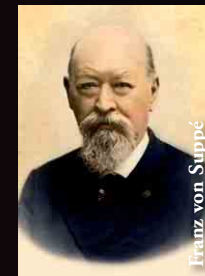
Franz von Suppé